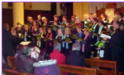
avec le Tourdion de Douai et la chorale Fa La La de Cambrai